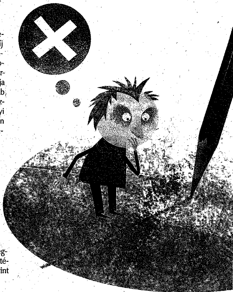
ILLUSZTRÁCIÓ: DÁNIEL ANDRÁS

■ A bruttó jövedelem 10 százalékát. Hogy ez pontosan mikortól érvényes, arról ellentmondásosan rendelkeznek a vonatkozó jogszabályok. A tagdíj felfüggesztéséről szóló – tavaly októberben megszavazott – törvény alapján 2012. január 1-jétől lép ez érvénybe, miközben a tavaly december 13-án módosított tb-törvény 2011. december 1-jéről beszél.